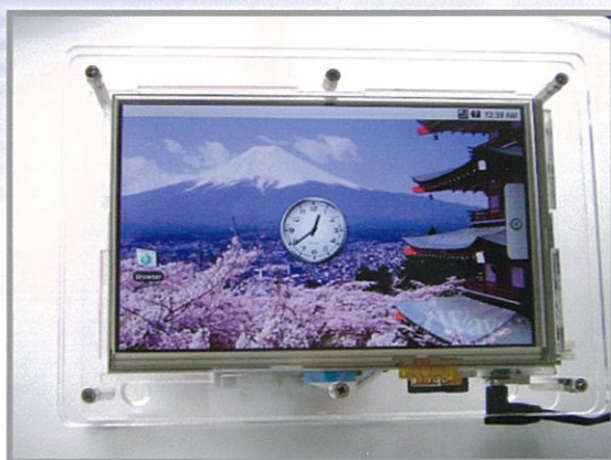
iW Rainbow-G3 プラットフォーム